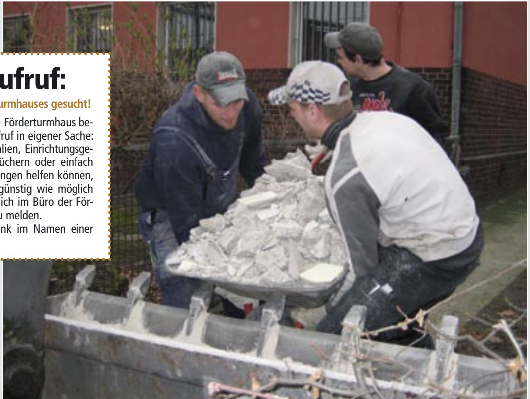
Mit Abbrucharbeiten hat der Umbau des Förderturmhauses begonnen. Unser Ziel ist es, noch vor den Sommerferien fertig zu sein.

Schon jetzt unseren herzlichen Dank im Namen einer möglichst effektiven Vereinsarbeit!