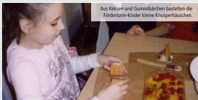
Aus Keksen und Gummibärchen bastelten die Förderturm-Kinder kleine Knusperhäuschen.

Wer sich also für ein echtes Kinder-Kunstwerk „à la Förderturm“ interessiert, kann am 04. März im Rahmen des Mitglieder-Abends bei Astrid und Arnold Puzicha die Förderturm-Kunstwerke bewundern. Direktorin Anja Warmuth wird dazu einige Informationen geben und, zusammen mit Armin Holle, 12 der Kunstwerke zugunsten des Förderturm e.V. verlosen. Wir hoffen auf großes Interesse!