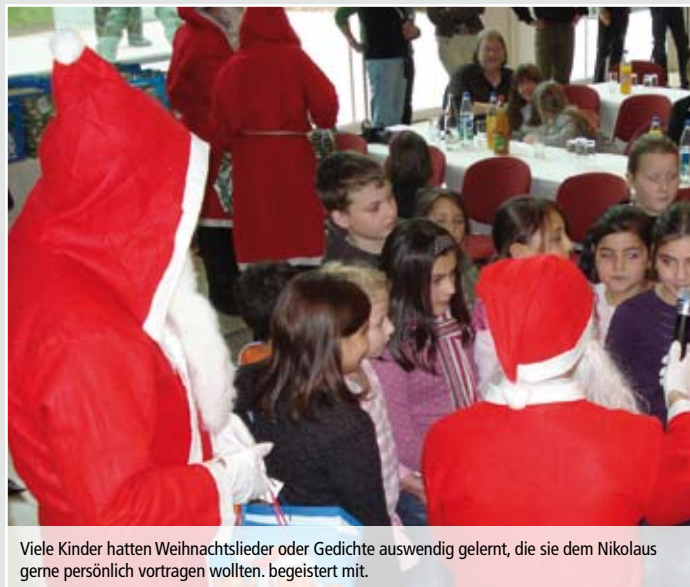
Viele Kinder hatten Weihnachtslieder oder Gedichte auswendig gelernt, die sie dem Nikolaus gerne persönlich vortragen wollten. begeistert mit.