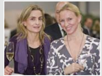
Pasta á la Monza – Das Catering war international, rasant und sehr gut.