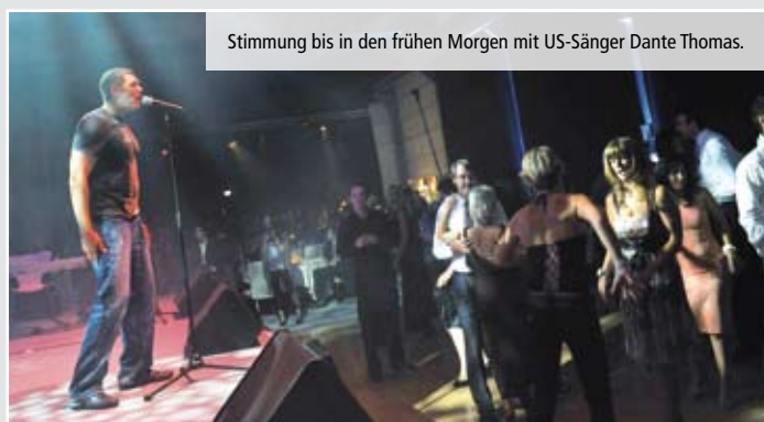
Stimmung bis in den frühen Morgen mit US-Sänger Dante Thomas.

Neben einem erneut sechsstelligen Spendenerlös, für den wir allen Sponsoren noch einmal ein großes Dankeschön sagen wollen,