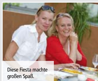
Diese Fiesta machte großen Spaß.