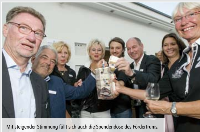
Mit steigender Stimmung füllt sich auch die Spendendose des Fördertrums.