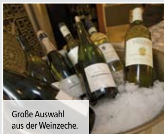
Große Auswahl aus der Weinzeche.