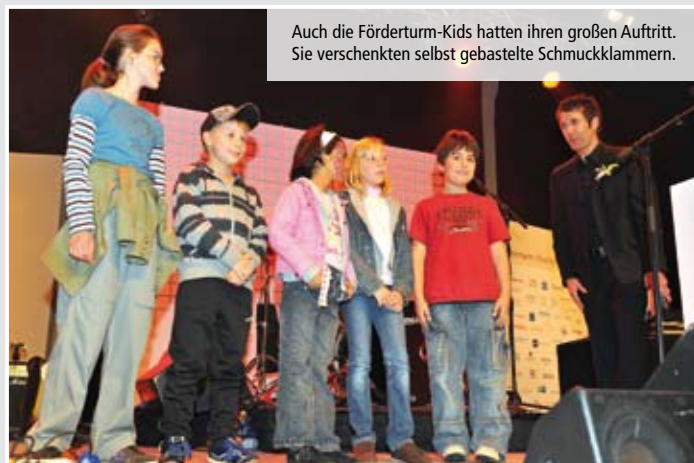
Auch die Förderturn-Kids hatten ihren großen Auftritt. Sie verschenkten selbst gebastelte Schmuckklammern.