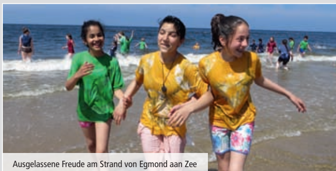
Ausgelassene Freude am Strand von Egmond aan Zee