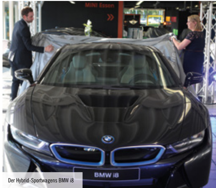
Der Hybrid-Sportwagens BMW i8