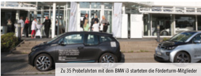
Zu 35 Probefahrten mit dem BMW i3 starteten die Förderturm-Mitglieder