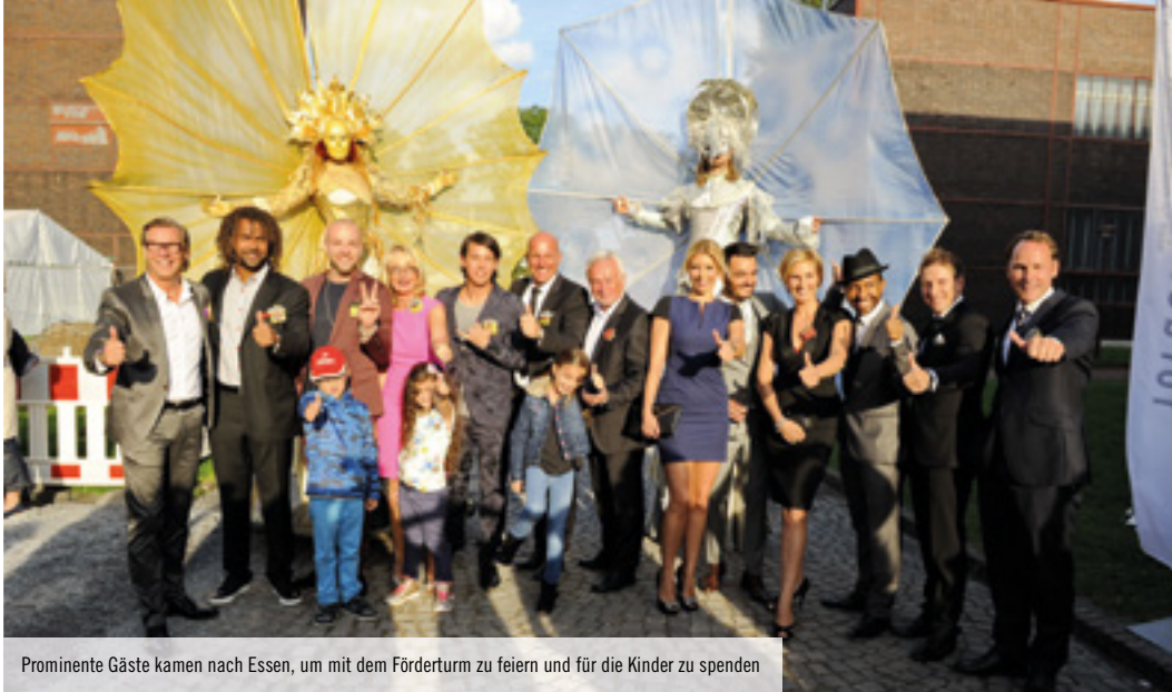
Prominente Gäste kamen nach Essen, um mit dem Förderturm zu feiern und für die Kinder zu spenden

Der 11. Förderturm Charity Golfcup spielte 211.000 Euro in die Kasse