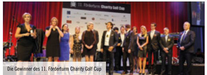
Die Gewinner des 11. Förderturm Charity Golf Cup