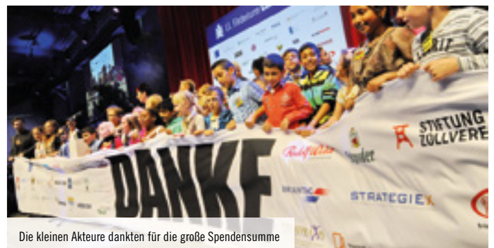
Die kleinen Akteure dankten für die große Spendensumme

Dienstag, 25.11.14 6. Night of Soul Roncalli Spiegelzelt am Jagdhaus Schellenberg Heisinger Straße 170a, Essen www.foerderturm.de