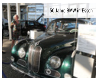
50 Jahre BMW in Essen

Herzlichen Dank an die Gastgeber, Akteure und Sponsoren des Abends: