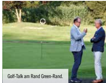
Golf-Talk am Rand Green-Rand.

So traumhaft kann ein entspannter Juniabend sein: Kulinarische Köstlichkeiten bei erfrischenden Getränken genießen und dabei die milde Sommersonne über einem