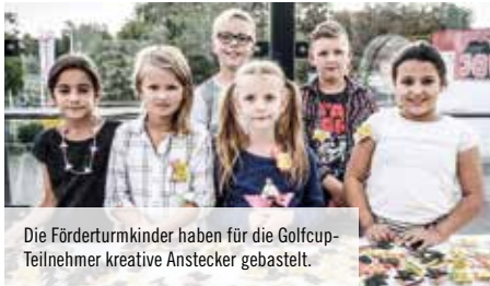
Die Förderturmkinder haben für die Golfcup-Teilnehmer kreative Anstecker gebastelt.

In der Golf- und Charitywelt ist unser Förderturm Charity Golf Cup (FCGC) seit langem eine bekannte Marke. In diesem Jahr findet er bereits zum 16. Mal statt und hat sich im Laufe