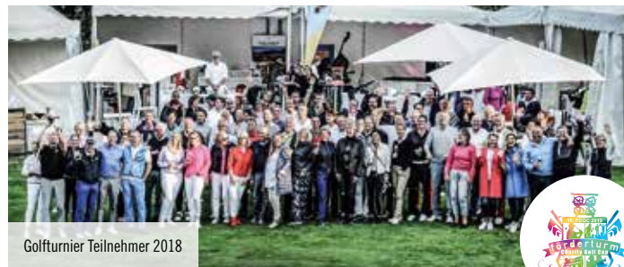
Golfturnier Teilnehmer 2018

Sternekoch Björn Freitag mit einem sagenhaften Menü verwöhnen wird.