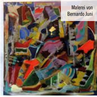
Malerei von Bernardo Juni

verzaubern von der individuell abgestimmten smarten Musikanlage in der Piano-Bar und tauchen Sie ein in die Wonne unseres umweltfreundlichen und thermonuklearen Wellnessbereichs," preist sich die Kunst-Installation Nøtel an, die der in London lebende, malaiisch-chinesische Künstler Lawrence Lek im Rahmen des Festivals „Urbane Künste Ruhr“ bis zum 30.06. in Essen präsentiert.