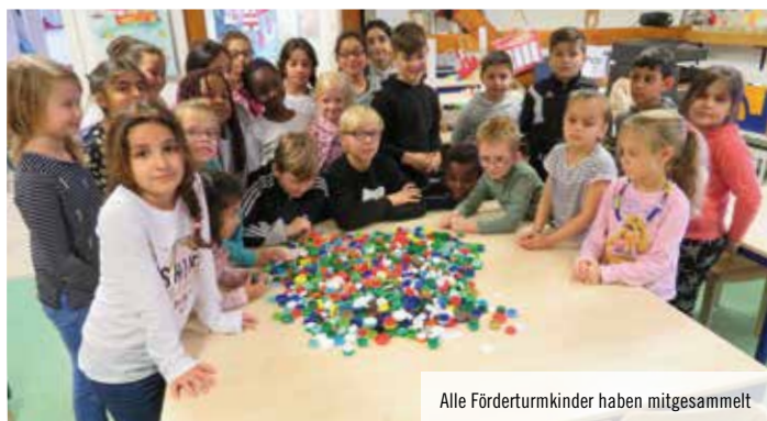
Alle Förderturmkinder haben mitgesammelt

Mit großer Leidenschaft haben die Kinder, Eltern und Erzieherinnen des Förderturmhauses von September 2018 bis zum Mai dieses Jahres Plastikdeckel von Flaschen gesammelt und damit eine Aktion des Rotary Clubs unterstützt. Schon mit dem Verkauf von 500 Plastikdeckeln an ein Recyclingunternehmen kann jeweils eine Impfung gegen Polio (Kinderlähmung) finanziert werden, „und wir haben sensationelle 10.000 Deckel in der Zeit gesammelt“, freuen sich die Förderturmkinder. Die Deckel werden beim Recycling zerkleinert und aus dem Granulat entstehen Produkte wie Rohre oder Gartenbänke. „Wir freuen uns, anderen Kindern helfen zu können, damit sie nicht krank werden“, sind die Förderturmkinder von ihrem Erfolg begeistert.