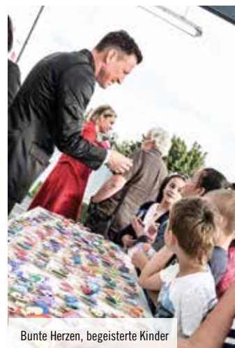
Bunte Herzen, begeisterte Kinder