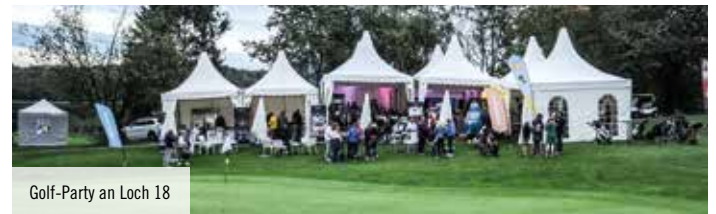
Golf-Party an Loch 18