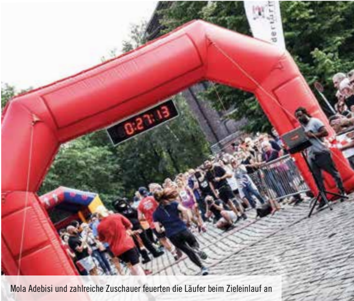
Mola Adebisi und zahlreiche Zuschauer feuerten die Läufer beim Zieleinlauf an