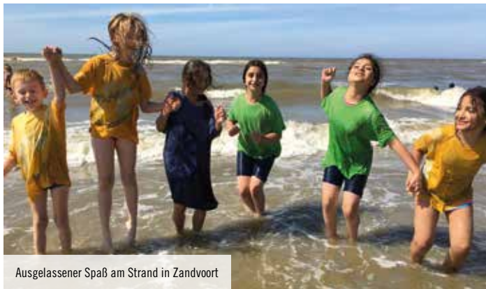
Ausgelassener Spaß am Strand in Zandvoort

berichten? Ach, lassen wir unsere Kids doch einfach selbst zu Wort kommen: