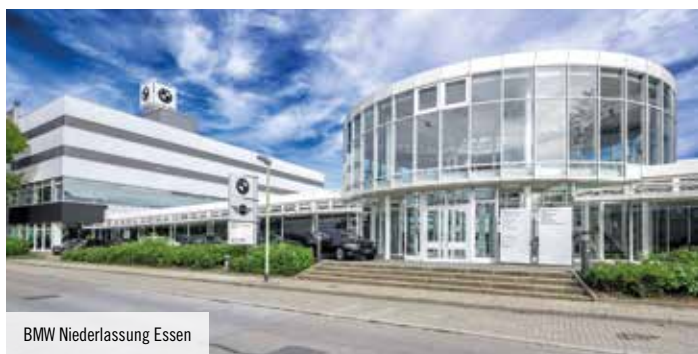
BMW Niederlassung Essen