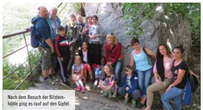
Nach dem Besuch der Bilsteinhöhle ging es rauf auf den Gipfel

rutschen waren voll groß und schnell und es war so heiß. Und wir haben Fangen im Wasser gespielt. Ich war auch mit dem Kopf unter Wasser.