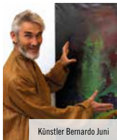
Künstler Bernardo Juni

Dieser mehrdimensionale Förderturmabend begeisterte mit Vielfalt