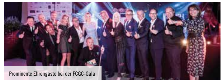
Prominente Ehrengäste bei der FCGC-Gala