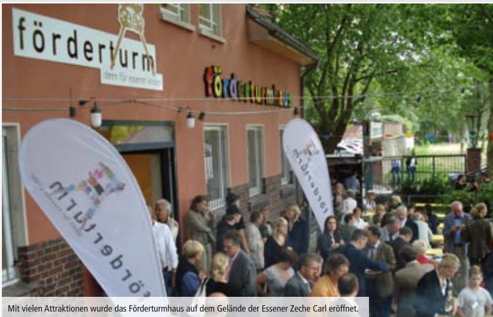
Mit vielen Attraktionen wurde das Fördererturmhaus auf dem Gelände der Essener Zeche Carl eröffnet.