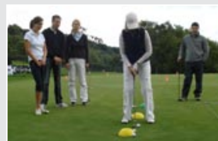
Mit Ruhe und Entspannung kommt man dem Ziel am nächsten. Beim Schnupperkurs konnten Nachwuchsgolfer Schlaggefühl entwickeln.