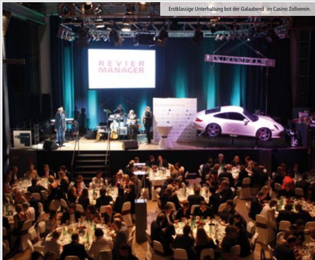
Erstklassige Unterhaltung bot der Galaabend im Casino Zollverein.

125.000 € für künftiges Förderturmhaus II auf dem Gelände des Weltkulturerbes Zeche Zollverein