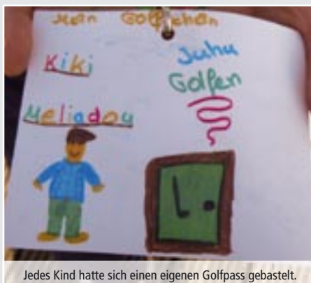
Jedes Kind hatte sich einen eigenen Golfpass gebastelt.