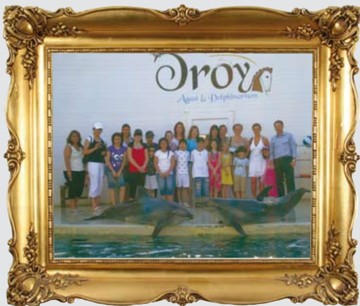
Der Besuch der Delphin-Show in Beleg war für die Förderturm-Kinder ein ganz besonderes Ereignis.