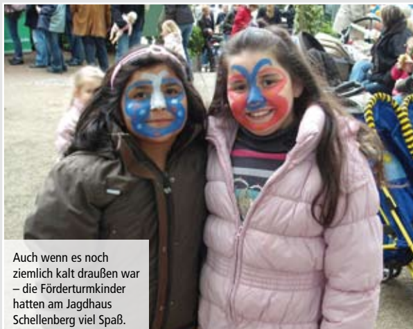
Auch wenn es noch ziemlich kalt draußen war – die Förderturm Kinder hatten am Jagdhaus Schellenberg viel Spaß.