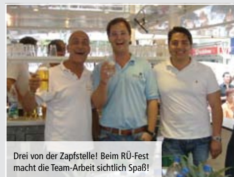
Drei von der Zapfstelle! Beim RÜ-Fest macht die Team-Arbeit sichtlich Spaß!