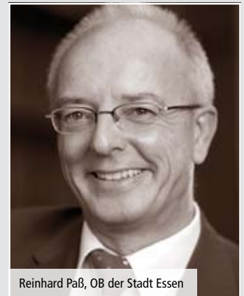
Reinhard Paß, OB der Stadt Essen