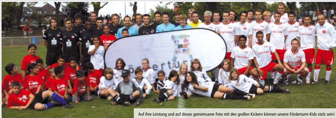
Auf ihre Leistung und auf dieses gemeinsame Foto mit den großen Kickern können unsere Förderturnm-Kids stolz sein!