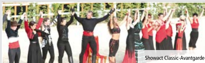
Showact Classic-Avantgarde-HORSES & DANCE.