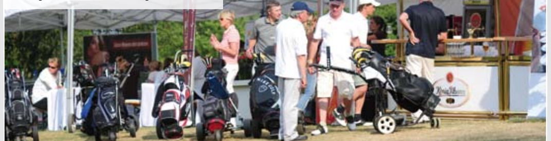
„Get together“ an Loch 18 am Freitag den 09.07.2010.

Dienstag, 09.11., ab 19 Uhr Förderturm-Mitgliederabend # 11 UBS Deutschland GmbH Trentelgasse 4 45127 Essen www.ubs.com/deutschland