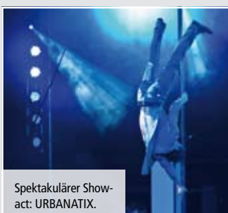
Spektakulärer Showact: URBANATIX.

Wir danken für Ihr Engagement und würden uns freuen, Sie bei vielen Förderturm-Events begrüßen zu können.