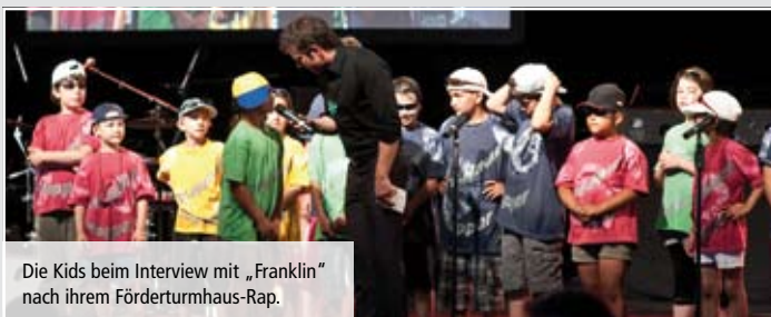
Die Kids beim Interview mit „Franklin“ nach ihrem Förderturmhaus-Rap.

„Die Ferien sind im Förderturmhaus besonders schön!“