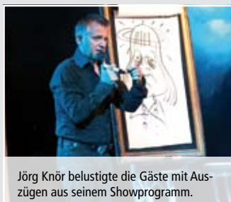
Jörg Knör belustigte die Gäste mit Auszügen aus seinem Showprogramm.