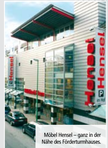
Möbel Hensel – ganz in der Nähe des Förderturnhauses.

Wir bitten um schnelle Rückantwort per Fax bis zum 15. Februar 2011!