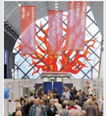
Die Messe-Galeria mit ihrer kunstvollen Glasfassade ist ein ganz besonderer Ort innerhalb der Messe Essen. Bei schönem Wetter kann eine große Terrasse zum Grugapark mit genutzt werden.