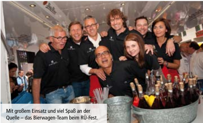
Mit großem Einsatz und viel Spaß an der Quelle – das Bierwagen-Team beim RÜ-Fest.

Ja, es hat schon was von guter, lieb gewonnener Routine, wenn das alljährliche RÜ-Fest startet und das Team vom Förderturm e.V. wieder mit viel Engagement, Leidenschaft und Spaß bei der Sache ist.