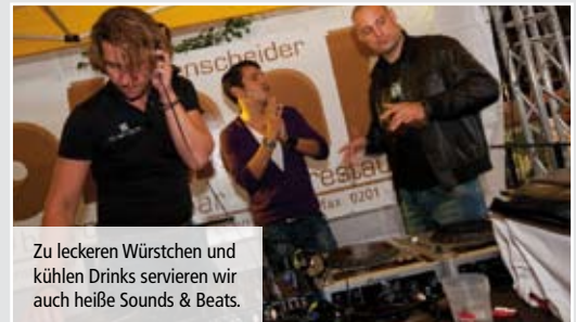
Zu leckeren Würstchen und kühlen Drinks servieren wir auch heiße Sounds & Beats.