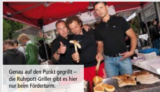
Genau auf den Punkt gegrillt – die Ruhrpott-Griller gibt es hier nur beim Förderturm.

Dienstag, 13.09.11, ab 19 Uhr Förderturm-Mitgliederabend # 14 bei der VGS Verlagsgruppe Stegenwaller in der SMAG-Lounge, Ruhrtalstraße 67, Essen www.verlagsgruppe-stegenwaller.de