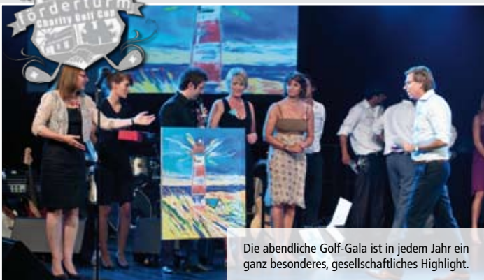
Die abendliche Golf-Gala ist in jedem Jahr ein ganz besonderes, gesellschaftliches Highlight.

Ein absolutes Highlight im Kalender ist für viele ohne Zweifel das traditionsreiche Fördererturm-Charity-Golfturnier. In diesem Jahr wird es am 15. und 16. Juli auf der schönen Anlage des Golfclubs Essen-Heidhausen stattfinden. Turnier-Organisator Peter