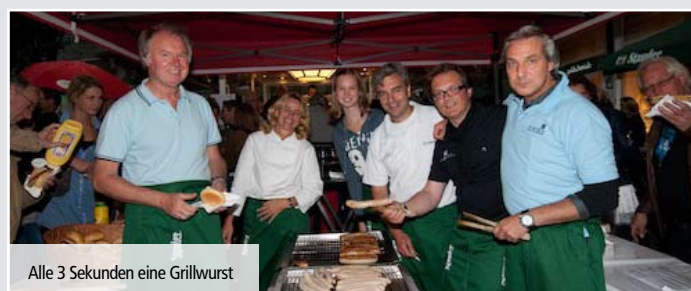
Alle 3 Sekunden eine Grillwurst