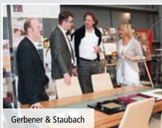
Gerbener & Staubach