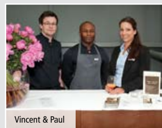
Vincent & Paul

Ein Verein, dessen Mitglieder – aus den unterschiedlichsten Branchen – sich im Rahmen einer eigenen Messe der Öffentlichkeit präsentieren? Und das Ergebnis ist ein engagiertes Hilfsprojekt für bedürftige Kinder? Zugegeben, manch einem ist es nicht so einfach zu erklären, was für uns im Förderturm e.V. selbstverständlich ist. Doch das Außergewöhnliche ist gleichzeitig das Besondere an unserem Konzept, bei dem sich soziales Engagement und freundschaftliches Networking die Waage halten.