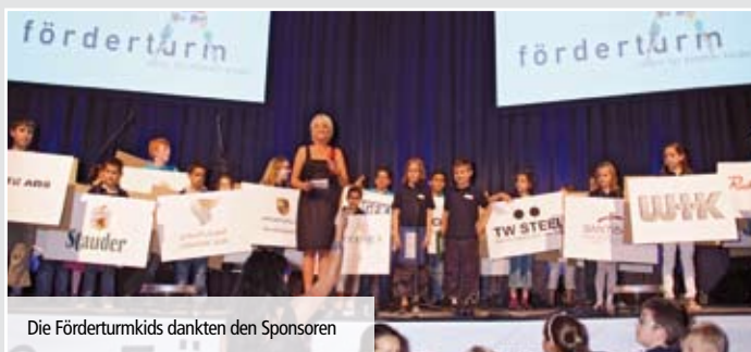
Die Förderturmkids dankten den Sponsoren