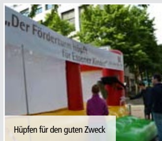
Hüpfen für den guten Zweck

Vielleicht kennen Sie ja noch weitere Freunde, Geschäftspartner oder Unternehmer aus der Region, die Ihrer Meinung nach gut zum Förderturm e.V. passen. Auf unserer Internetseite finden Sie dafür den Mitgliedschaftsantrag zum Download.