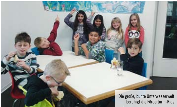
Die große, bunte Unterwasserwelt beruhigt die Förderturm-Kids