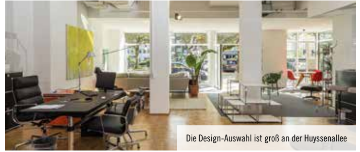
Die Design-Auswahl ist groß an der Huysenallee

turmhaus sowie bei unterschiedlichen Ausflügen ihren Horizont erweitern können.“ Für den 26. März lädt der Einrichtungs-Designer alle Förder-