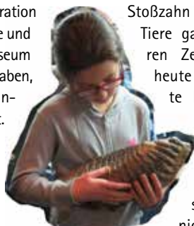
Selen mit einem fossilen Exponat aus der Urzeit

hauses in Kooperation mit der Karlschule und dem Ruhr Museum teilgenommen haben, leider nicht verlängert worden ist. Von ihren Museumserlebnissen waren sie so begeistert, dass sehr oft die Frage kam: „Wann gehen wir mal wieder ins Museum?“