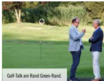
Golf-Talk am Rand Green-Rand.

So traumhaft kann ein entspannter Juniabend sein: Kulinarische Köstlichkeiten bei erfrischenden Getränken genießen und dabei die milde Sommersonne über einem