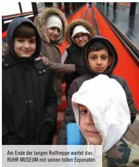
Am Ende der langen Rolltreppe wartet das RUHR MUSEUM mit seinen tollen Exponaten.

hauses in Kooperation mit der Karlschule und dem Ruhr Museum teilgenommen haben, leider nicht verlängert worden ist. Von ihren Museumserlebnissen waren sie so begeistert, dass sehr oft die Frage kam: „Wann gehen wir mal wieder ins Museum?“