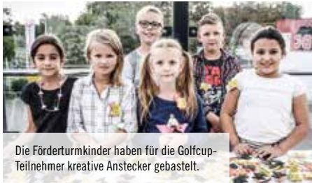
Die Förderturmkinder haben für die Golfcup-Teilnehmer kreative Anstecker gebastelt.

der Jahre zu einem der spendenintensivsten Golf-Events in Deutschland entwickelt. Hier werden Jahr für Jahr Rekordsummen gespendet, die ausschließlich der Arbeit mit Essener Kindern im Förderturmhaus zugutekommen.