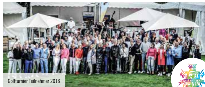
Golfturnier Teilnehmer 2018