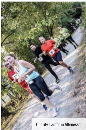
Charity-Läufer in Altenessen

3. Förderturm Charity Lauf startet am 29. August am Allee-Center