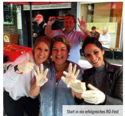
Start in ein erfolgreiches RÜ-Fest

alle im Team sowie besonders an unsere Mitglieder und Sponsoren, die Bio-Bäckerei Backbord, die Menken-Ruhrpottgriller, die Bliss – Tapasbar, Getränke Possemeyer und natürlich die Privatbrauerei Stauder."