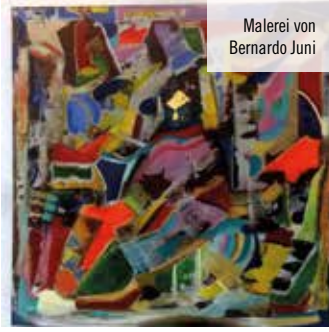
Malerei von Bernardo Juni

verzaubern von der individuell abgestimmten smarten Musikanlage in der Piano-Bar und tauchen Sie ein in die Wonne unseres umweltfreundlichen und thermonuklearen Wellnessbereichs," preist sich die Kunst-Installation Nøtel an, die der in London lebende, malaiisch-chinesische Künstler Lawrence Lek im Rahmen des Festivals „Urbane Künste Ruhr“ bis zum 30.06. in Essen präsentiert.