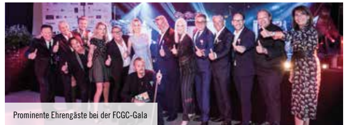
Prominente Ehrengäste bei der FCGC-Gala