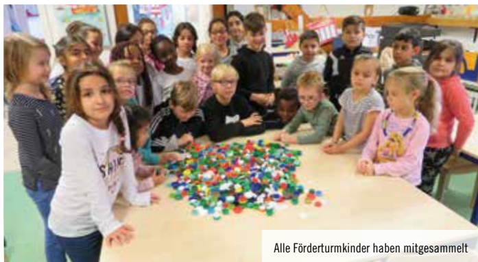
Alle Förderturmkinder haben mitgesammelt

Mit großer Leidenschaft haben die Kinder, Eltern und Erzieherinnen des Förderturmhauses von September 2018 bis zum Mai dieses Jahres Plastikdeckel von Flaschen gesammelt und damit eine Aktion des Rotary Clubs unterstützt. Schon mit dem Verkauf von 500 Plastikdeckeln an ein Recyclingunternehmen kann jeweils eine Impfung gegen Polio (Kinderlähmung) finanziert werden, „und wir haben sensationelle 10.000 Deckel in der Zeit gesammelt“, freuen sich die Förderturmkinder. Die Deckel werden beim Recycling zerkleinert und aus dem Granulat entstehen Produkte wie Rohre oder Gartenbänke. „Wir freuen uns, anderen Kindern helfen zu können, damit sie nicht krank werden“, sind die Förderturmkinder von ihrem Erfolg begeistert.